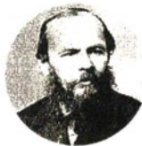
Pensatori Nietzsche (in alto) e Dostoevskij

Il nichilismo nella filosofia di Nietzsche (1844-1900), promuove e accelera il processo di distruzione degli ideali tradizionali, per rendere possibile l'affermazione di nuovi valori. Ma è anche un movimento russo del secondo 800, che mirava alla soppressione violenta dell'ordinamento sociale e politico. Dostoevskij in Delitto e castigo lo avversa con la figura di Raskol'nikov